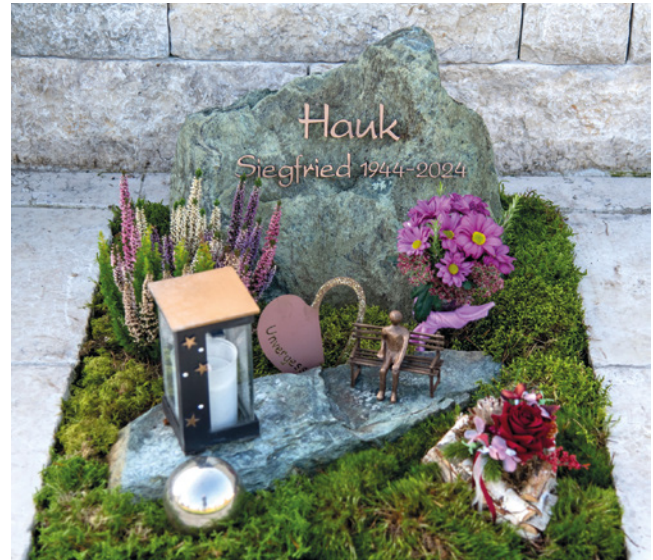
Findling aus SERPENTIN QUARZIT