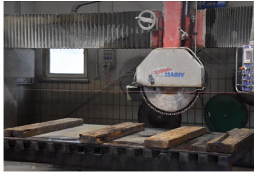
Das Team der Firma Zenk nutzt zur Steinbearbeitung diese Brückensäge des tschechischen Herstellers Euro Masiv.