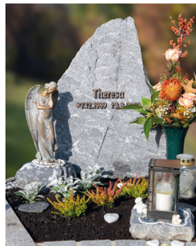
Links: Dreiteiliges Grabmal aus ORIENT BEIGE, IMPALA GRANIT, mit Glaseinsatz und Einfassung aus IMPALA GRANIT; matt geschliffen Rechts: Findling aus SCHNEEFELSEN MARMOR