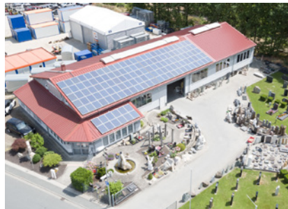
Die Grabmalausstellung rund um das Firmengelände des Steinmetzbetriebs Zenk in Hausen

Die Kundin war über die Idee verblüfft. Sie zweifelte, ob das möglich ist. »Aber klar, warum sollte man das nicht machen können?«, sagte Stefan Zenk. Unlängst traf er die junge Frau wieder auf dem Friedhof. »Sie kam auf mich zu und fragte, ob sie mich mal drücken dürfe«, erzählt der Steinmetzmeister