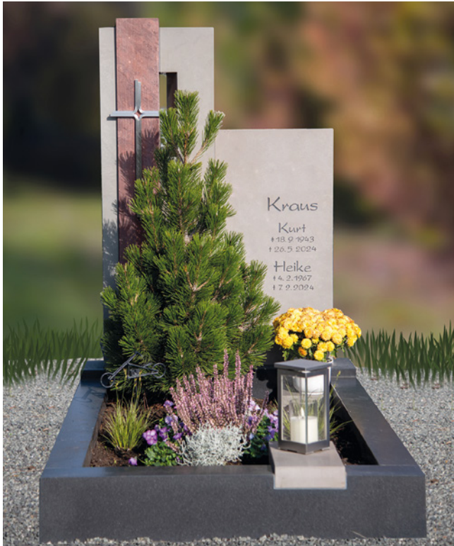
Zweitelliges Grabmal aus MONSERAT QUARZIT mit eingestetztem Teil aus VERONA ROT QUARZIT, Einfassung aus SSY GRANIT; satiniert/geledert